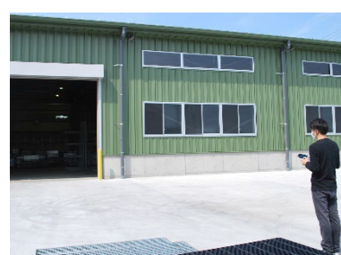
ドローンでの撮影