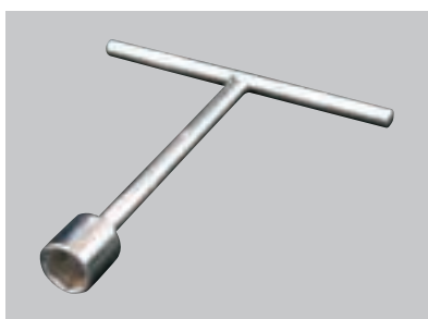
T型レンチ(M16用) 定価 3,300円/本