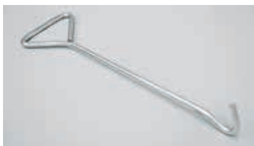
細目用取りはずし金具 定価 1,400円/本