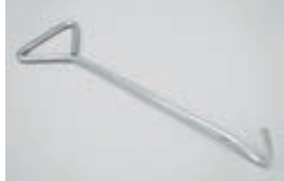
細目用取りはずし金具 定価 1,400円/本