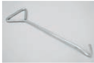
細目用取りはずし金具 定価 1,400円/本